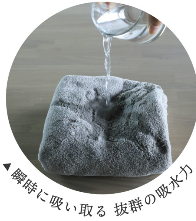
吸水性比較データ（自社調べ）